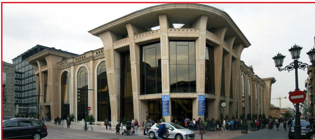
Vista exterior del Auditorio “Príncipe Felipe de Oviedo”.

Organizado por Working Comunicación, la I Edición del Fórum Urbanismo y Construcción Sostenible se celebrará el día 30 de noviembre de 2016 en Oviedo. Fórum Urbanismo y Construcción Sostenible , es un evento de ámbito nacional, que tendrá lugar en el Auditorio “Príncipe Felipe”.