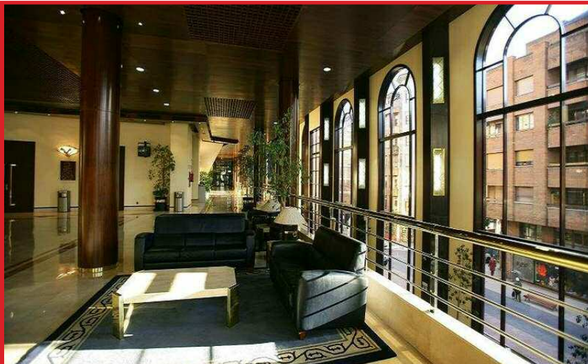
Vista interior del Auditorio "Príncipe Felipe de Oviedo".

El conseguir la excelencia en los edificios y el equilibrio entre maximizar el beneficio, el menor impacto en el medioambiente y un mayor bienestar para las personas que viven o trabajan en ellos, ya se ha logrado en España. Hay muchas empresas en nuestra nación que se han dado cuenta, lo han visto, se han puesto manos a la obra y lo han logrado, contribuyendo con su esfuerzo a que tengamos unos edificios mejores a un coste menor.